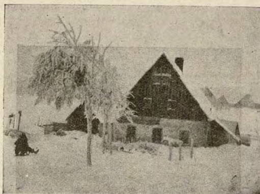
Un chalet dans les montagnes, tout à fait caché dans la neige, nous y attend

« Tu vas écrire un article sur les Girl-Scouts Tchécoslovaques », me dit la Commissaire Régionale hier. « Tu vas l'envoyer à Mlle Moreau avant le 5 janvier avec quelques belles photos. Tu peux écrire ce que tu veux ». Mon Dieu! Ma chère Commissaire, tu as beau dire... C'est le 1 er janvier aujourd'hui et me voilà revenue des montagnes où j'ai passé mes vacances de Noël avec ma troupe, des montagnes couvertes de neige, d'une contrée dont la blancheur et la quiétude sont encore présentes dans mon esprit... « Tu peux écrire ce que tu veux ». Mon Dieu, si je savais seulement, ce que c'est que je veux! Il y a bien des choses à dire, mais il y a aussi un grand danger dans la permission mentionnée : que, songeant à ce qui serait le plus propre à écrire, je puisse tomber de nouveau dans ma rêverie sur les montagnes blanches et écrire ad infinitum sur les beautés des montagnes neigeuses et des jours joyeux passés au milieu d'elles. Mais il faut retourner à la réalité, car bien que faire du ski et camper en hiver soit une partie considérable du programme de nos troupes, pour avoir une idée plus complète de leurs activités, il faut les suivre pendant toute l'année.