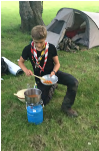
Repas Trappeur, un classique !