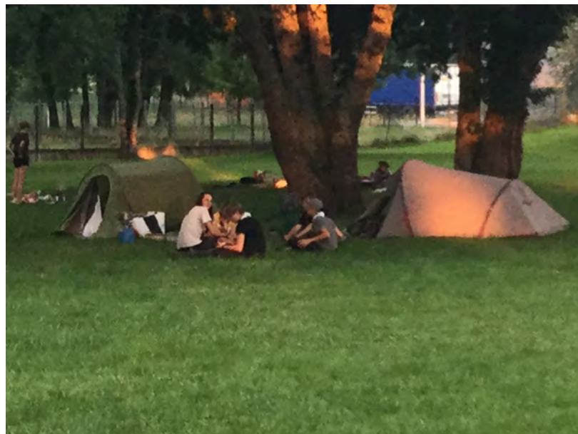
Plus de 100 éclé.e.s demain en Explo autour de Tiers et Viscomtat